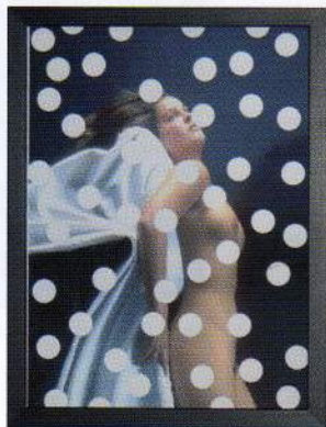
>>> Sans titre, 2008.